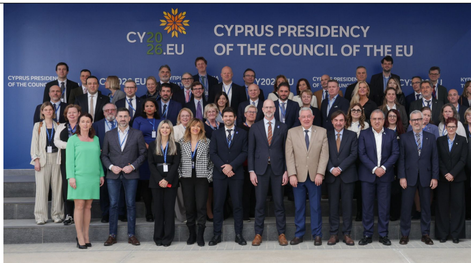
Bild. Ett traditionellt fotografi med alla som deltog på mötet.