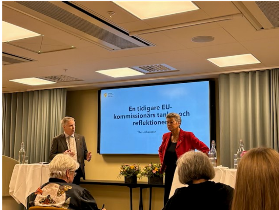
Bild: Ylva Johansson.